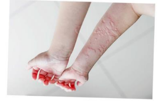
APA ITU GEGATA?

Gegata ialah bintik merah gatal pada kulit. Boleh jadi kecil atau besar dan bercantum.